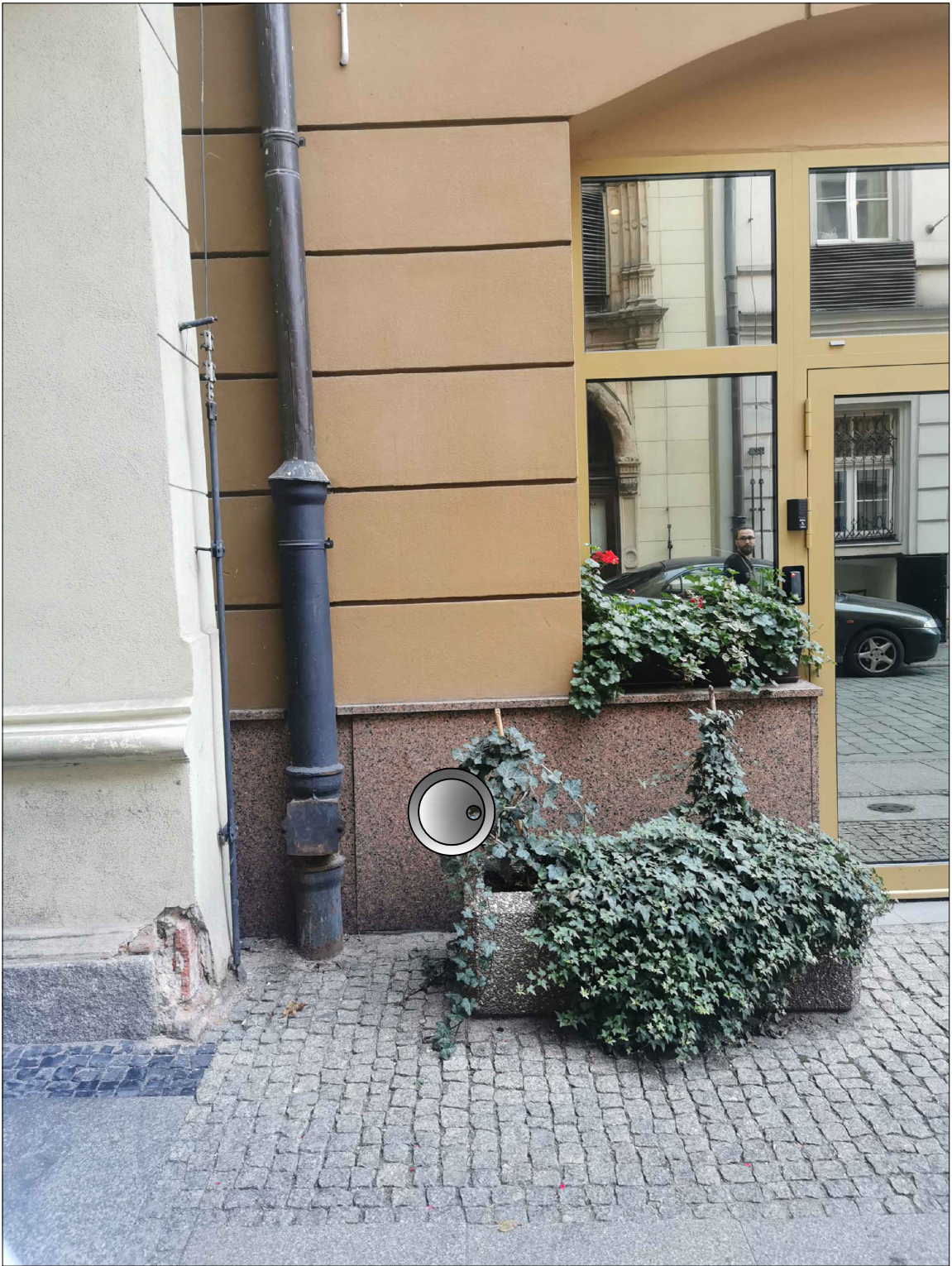
URZĄD MIEJSKI MIASTA WROCŁAWIA Wrocław, Sukiennice 8